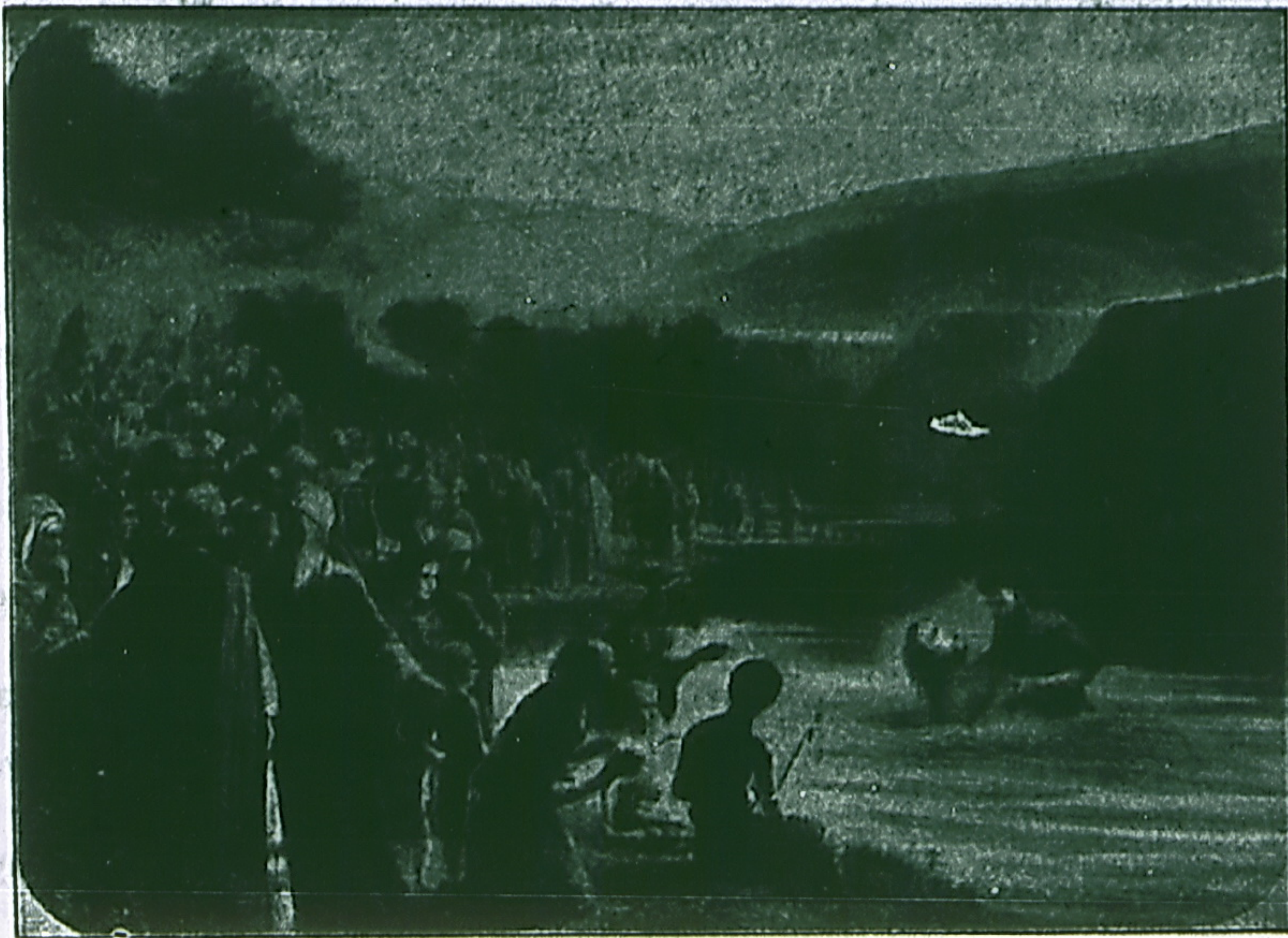
Крещение Иисуса Христа отъ Иоанна въ рѣкѣ Иорданѣ.

...Идите, научите все народы, крестя ихъ именемъ Отца и Сына и Святаго Духа, уча ихъ соблюдать все, что Я повелѣлъ вамъ. (Мат. 28, 19, 20).