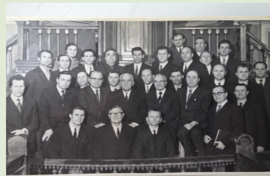
Со священнослужителями г. Москвы

Божьим нужно держаться Писания во все времена, проповедовать Слово Божие, волю Божию, не подделываться под те слабости, которые есть у человека.