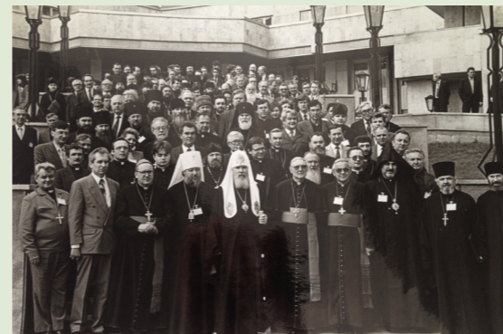
Международная конференция "Христианская вера и человеческая вражда" 1994 г.

- Безусловно, изменились. Но эти изменения происходят постепенно, незаметно. Что-то меняется в лучшую сторону, что-то в худшую. Свобода - это тот период, который не всегда полезен для церкви в духовном отношении. При гонениях церковь была сплоченная, мы чувствовали, что мы одна семья. Сейчас этого нет. Окружающий нас мир меняется. Очень сильно в худшую сторону. То, что 20-30 лет назад считалось плохим, теперь является нормой. И это действует на церковь, особенно на молодежь, на христианские семьи. Участились разводы, которых раньше практически не было. Как написано в Библии, по умножению беззакония во многих охладает любовь. Но не нужно отчаиваться. Служителям