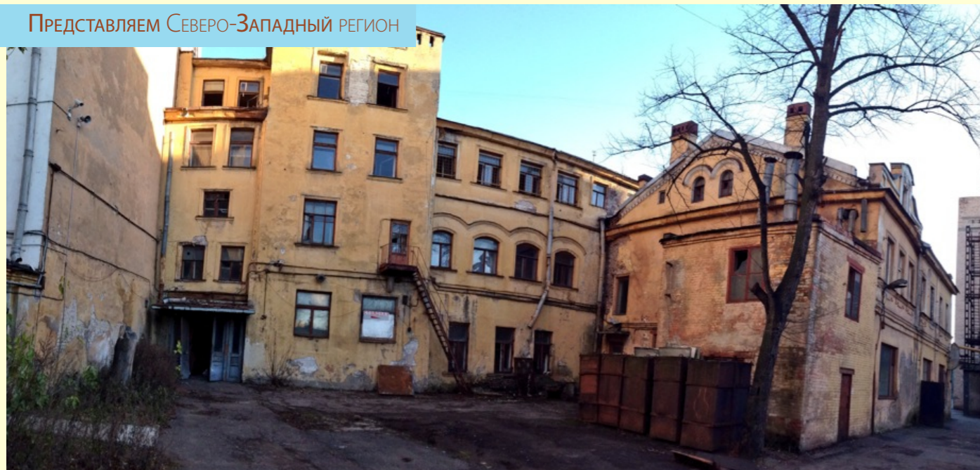
Дом Евангелия сегодня