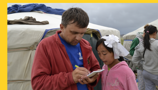
Служение монгольским детям