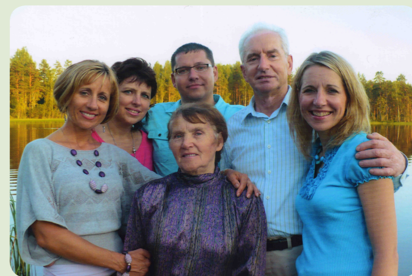
С дочерьми и сыном