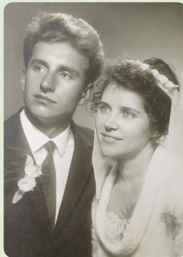
Свадьба (49 лет назад)