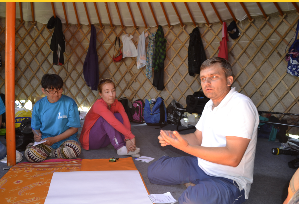
Служение монгольским детям