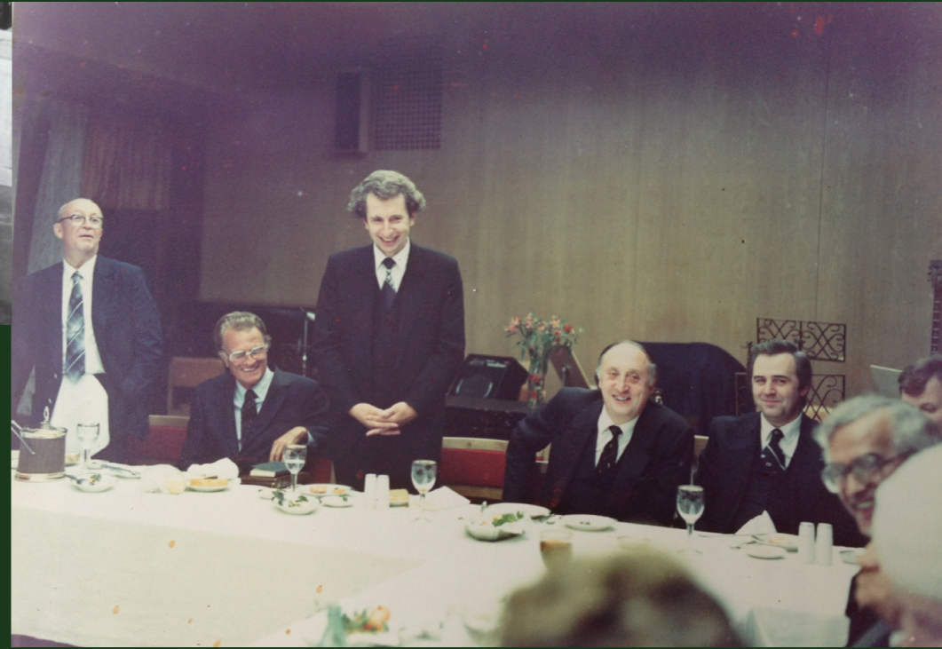
◀ На встрече со всемирно известным Билли Гремом