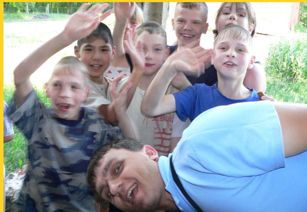
Служение с детьми в детском доме