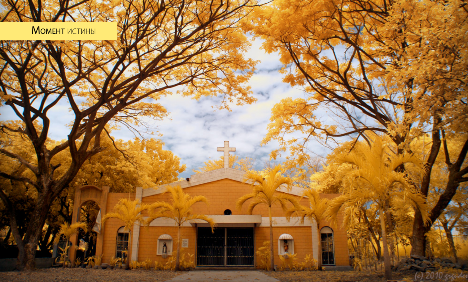
Церковь в провинции Лагуна. Филиппины

продолжается уже сотни и тысячи лет. Это был момент смены эпох. Наступала новая эра – эра Церкви. Мир уже никогда не будет прежним. Потому что появилась Церковь Христова.