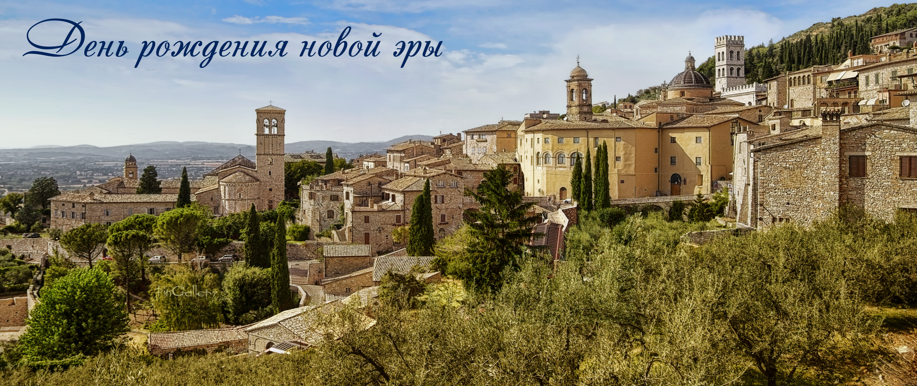
г. Ассизи, в провинции Перуджа. Италия

Это статья о рождении Церкви. Сначала скажу три интересные вещи.