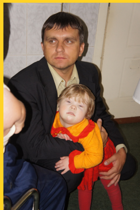
В детском доме для умственно отсталых детей